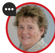
ISABELLE ADENOT Présidente de la Commission nationale d'évaluation des dispositifs médicaux et des technologies de santé (CNEDiMTS) HAUTE AUTORITÉ DE SANTÉ